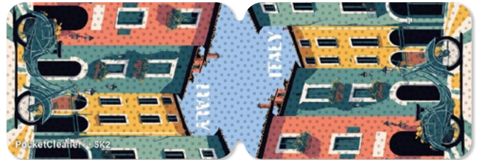
Ansicht des fertigen PocketCleaner® mit Simulation der Antirutsch-Beschichtung