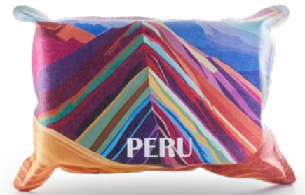
Ansicht des fertigen CarKoser®

*Herstellerkennzeichnungspflicht: Beachten Sie die Pflichtangaben laut EU-Produktsicherheitsverordnung (EU-ProdSV) 2023/988. Gemäß dieser müssen alle Verbraucherprodukte dauerhaft mit einer Herstellerkennzeichnung, einer Artikelidentifikation sowie Sicherheitsinformationen versehen werden. Die Position der Angaben ist frei wählbar.