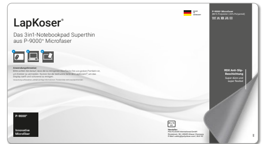
Ansicht der fertigen Einlegekarte