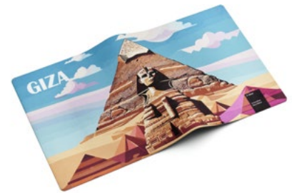
Ansicht des fertigen LapKoser®

! Aufgrund technischer Gegebenheiten im Druckprozess, wie Druckstandschwankungen und Schneidtoleranzen (+/- 2 mm), kann der erstellte Rahmen nicht immer parallel zum Rand des Tuchs verlaufen. Es kann daher vorkommen, dass die Ränder unterschiedliche Breiten haben, z.B. 8 mm auf der linken Seite und 12 mm auf der rechten Seite.